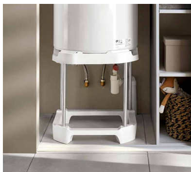
Calypso Connecté vertical mural est compatible avec le trépied universel Code 009243