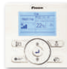
En option (BRC073)